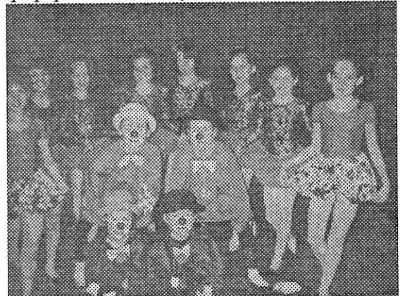
Foto: žáčky ZŠ zahájily ples předtančením

Ještě jednou děkujeme všem sponzorům, rodičům i podnikům za pomoc při přípravě naší tomboly.