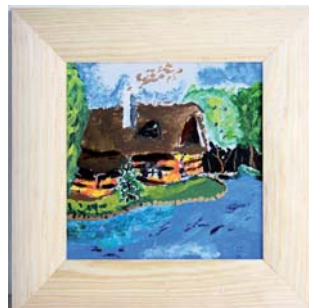
Michal Opálka, U rybníka