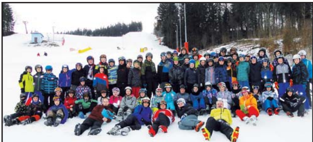
Společná fotografie z Karolinky všech zúčastněných lyžařů

Viděli jste v neděli 26. února před školou velké srocní dětí s batohy, taškami a lyžemi? Tak to jsme odjížděli na Čarták za týdenním dobrodružstvím na chatě, ale hlavně, to doufám, za lyžováním na svahu v Karolince. Do čeho jdou, nevěděli jen šestáci, ostatní jsou už zkušení borci z minulých let.