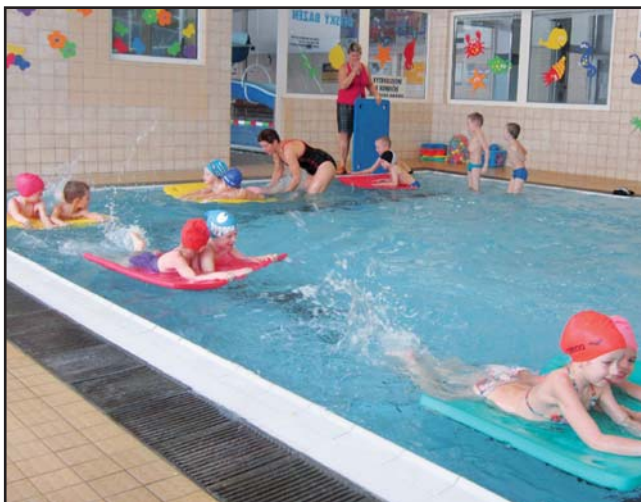
Naše první plavání