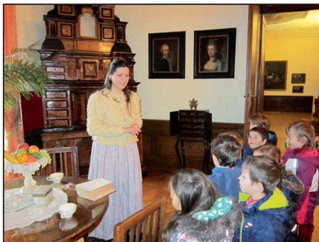
Návštěva zámku Lešná. Výchovně vzdělávací program Princezna v komnatách.