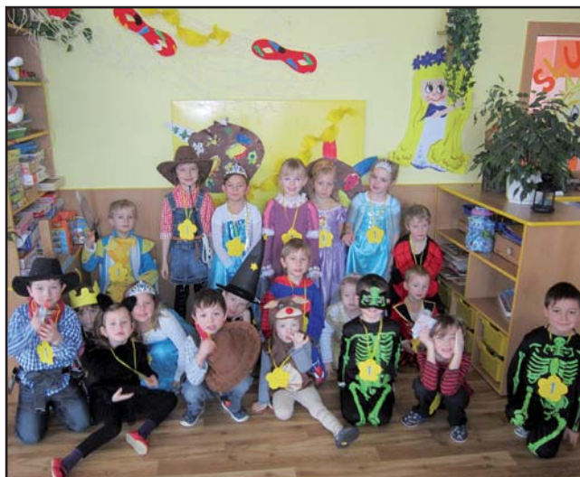
Karneval ve třídě SLUNÍČKA.