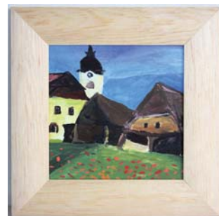
Michal Pernica, Staré rožnovské náměstí