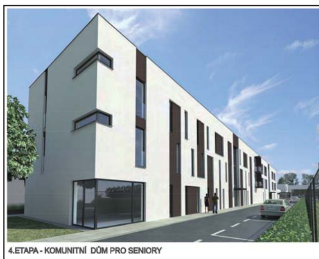
4.ETAPA - KOMUNITNÍ DŮM PRO SENIORY

pro seniory, dostupnost lékařské služby, lékárny a nákupního centra, dostupná autobusová a železniční zastávka. Současná kuželna a ubytovna je ve špatném, až havarijním stavu. V minulosti byl zpracován projekt na její rekonstrukci, kde se plánovalo vybudování ubytovacího zařízení. Podle informací, které jsme získali, by za určitých okolností byl o takovýto objekt v Zubří zájem, ale vzhledem k tomu, že v okolních městech nejsou mimo sezónu stávající ubytovací kapacity zdaleka využity, myslíme si, že toto je spíše prostor pro podnikatele, než pro město.