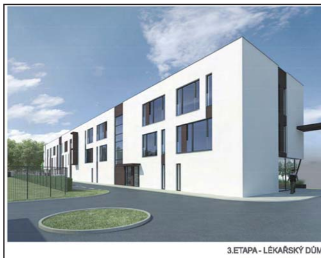
3.ETAPA - LÉKAŘSKÝ DŮM

Na to navazuje dům pro seniory. O tomto zařízení se taky v zastupitelstvech debatovalo několik let, ale nikdy nedošlo k dohodě a realizaci, a to z různých důvodů. Po konzultacích a hledání vhodného místa bylo schváleno realizovat tento objekt na místě stávající kuželny. Klady převažovaly: dostatek parkovacích prostor jak pro lékařský dům, tak pro dům