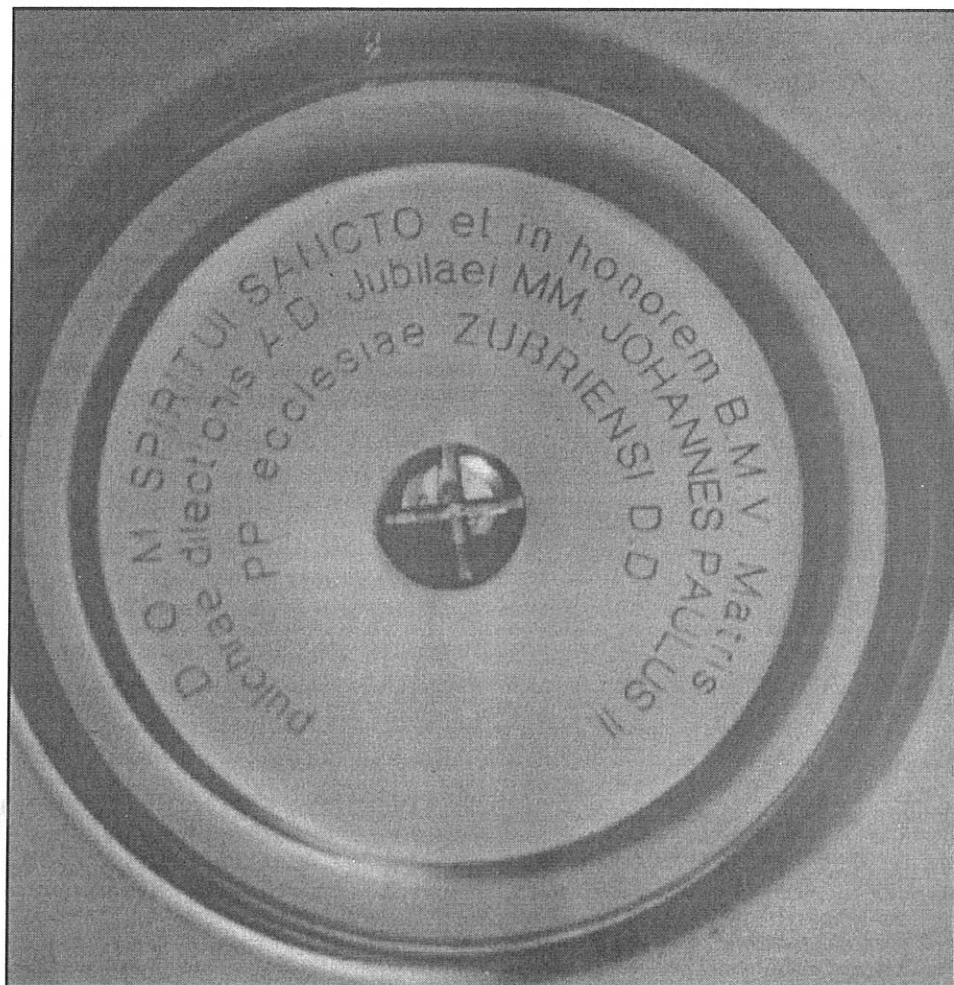
Věnování na spodní části kalicha.