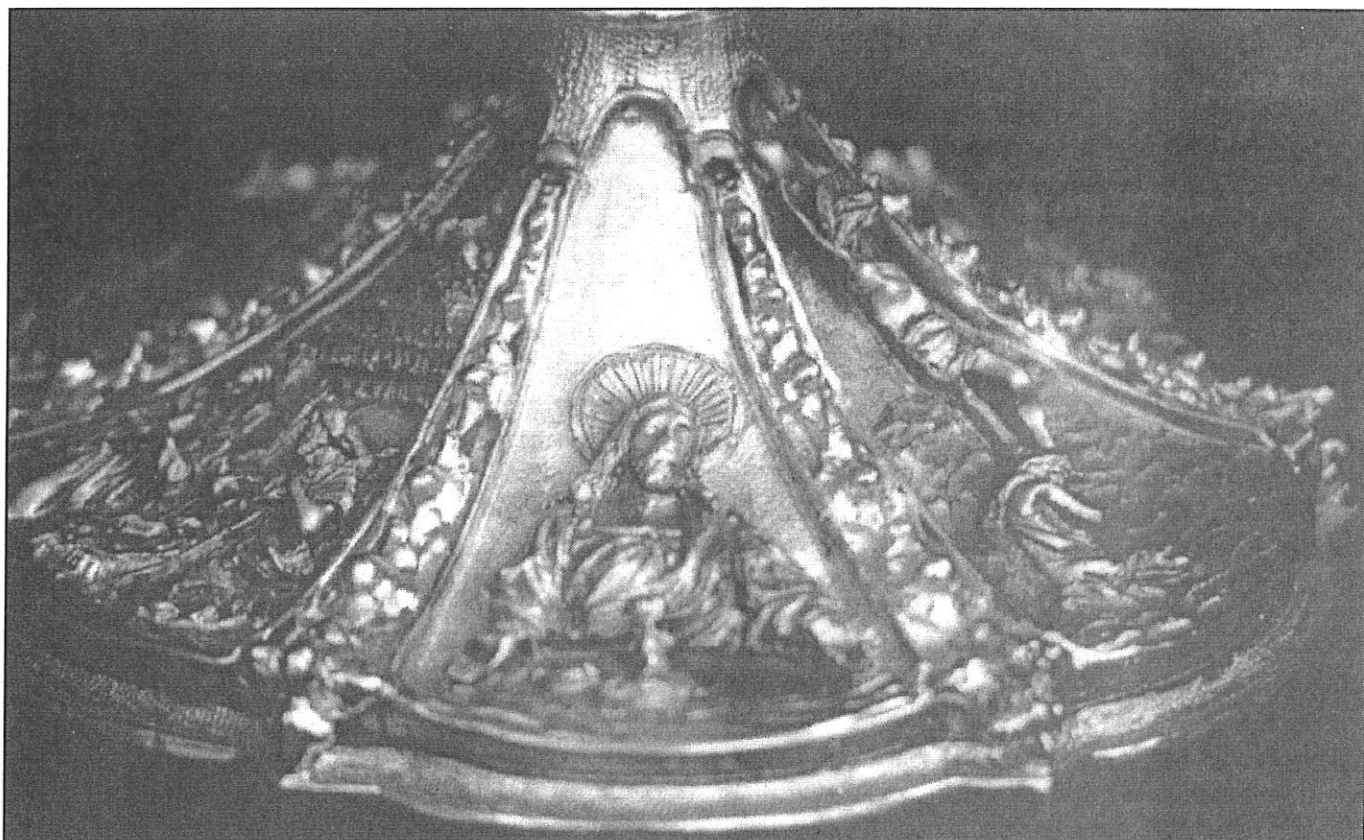
Detail základní části kalichu ze zlaceného stříbra.