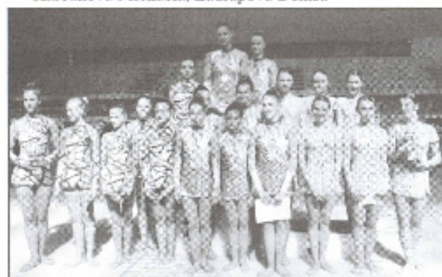
Oddíl moderní gymnastiky TJ Gumárny Zubří