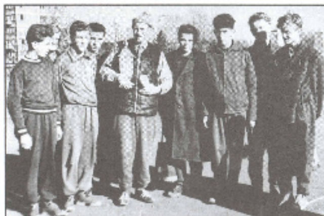
Stadion Mládeže Zlín, červen 1957

Koncem června roku 1957 jsme byli na závodech Valašské Kotáry kolem filmových ateliérů v Gottwaldově. Jako kolektiv Odborného učiliště KEZ jsme zvítězili nad všemi učilišti, které se účastnily tohoto sportovního klání. Nakonec byla pro nás velká čest, že jsme se mohli vyfotit na Stadionu Mládeže s p. Emilem Zátopkem.