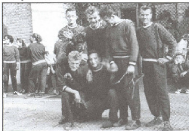
Sportovní hry před učilištěm KEZ 1957 - Zlín

V mých patnácti letech byla pro mne velká čest, že jsem mohl běžet s olympijským vítězem Emilem Zátopkem. Celá naše běžecká skupina si toho nesmírně vážila. I když už ty kluky, s kterými jsem běhával, všechny neznám, snad jenom některé - Vicha, Šekamina, Jupa. Byly to krásné roky, na které rád vzpomínám.