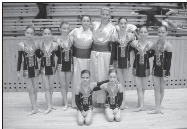
Gymnastky 10 - 12 let

Toto mistrovství bylo zároveň 5. pohárovým závodem v ESG Cupu 2010. Děvčata kategorie 10 – 12 let se stala nejen vítězkami pátého závodu, ale také celkovými vítězkami ESG Cup 2010. Mladší kat. 8 – 10 let získala v celkovém pořadí ESG Cup 2010 4. místo. Plzeňská hala, která je většinou svědkem házenkářských utkání, se tak na jeden den změnila v přehlídku nádherných tanečních vystoupení, kterými je estetická gymnastika tak výjimečná. Uzávěření letošní gymnastické sezóny v našem oddíle nemohlo být lepší.