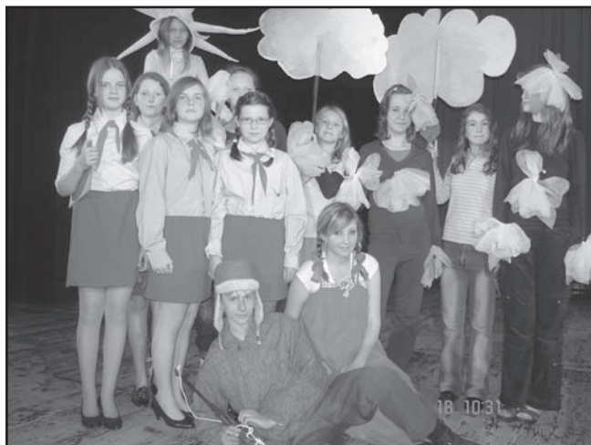
Výběr fotografií z úspěšné akademie „Jak šel čas ... aneb stařenka vypravuje“. DVD možno objednat v ZŠ Zubří.