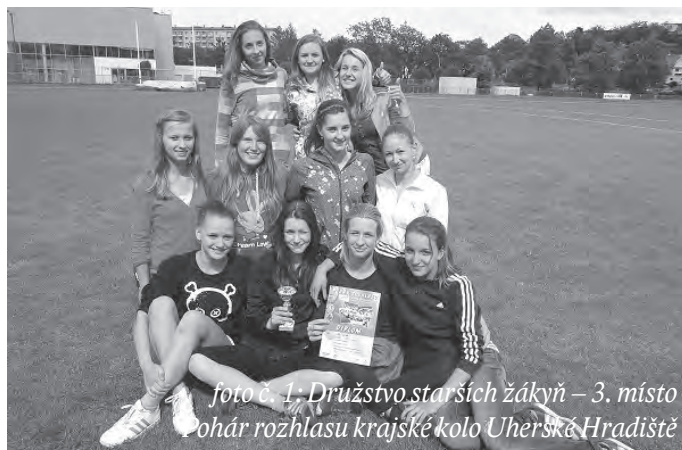
foto č. 1: Družstvo starších žáků – 3. místo Pohár rozhlasu krajské kolo Uherské Hradiště

I když nám v úterý 21. května na atletickém stadionu v Hradišti počasí moc neprálo, starší děvčata jako vítězky a nejlepší družstvo okresu Vsetín zabojovala a získala krásné 3. místo a stala se tak třetím nejlepším