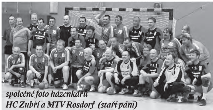
společné foto házenkářů HC Zubří a MTV Rosdorf (staří páni)

Všechna utkání měla krásnou hlasitou atmosféru a určitě si to všichni hráči a fanoušci vychutnali. Po sportovním odpoledni následovalo grilování s diskotékou. Oslavy vítězství pokračovaly v kempu Stolle. Zpívalo se při kytáře, hodnotily se sportovní a fanouškovské výkony.