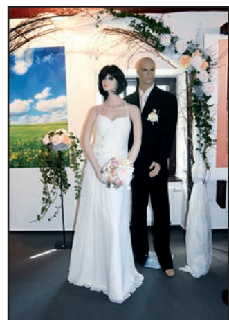
Malá fotoreportáž z vernisáže