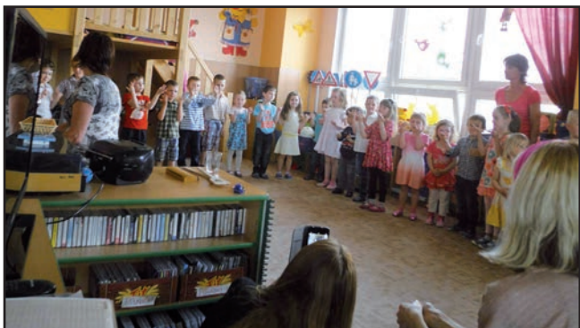
Besídka pro maminky ke Dni matek proběhla 17. 5.