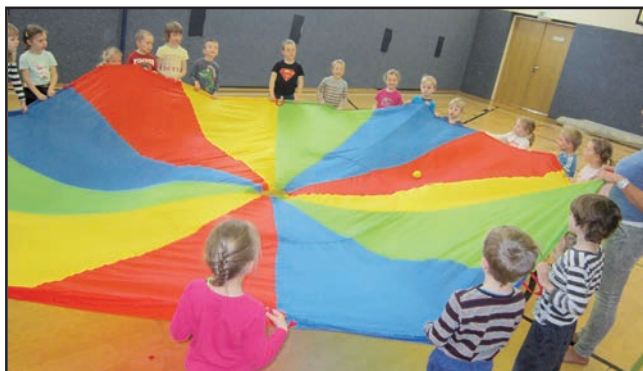
Cvičíme v sokolovně