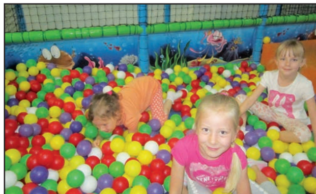
Výlet do Pohádkových lázní