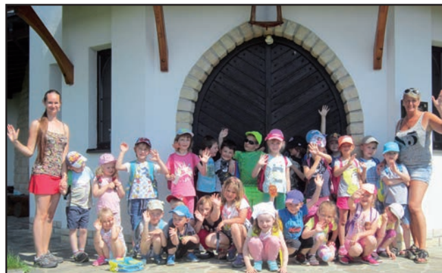
Výlet na Staré Zubří. Turistická vycházka za poznáním přírody a okolí našeho města.