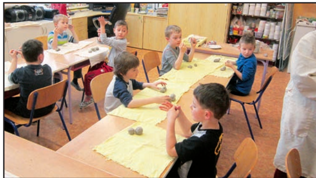
Vyrábíme srdíčka pro maminky ve Středisku volného času v Rožnově pod Radhoštěm.