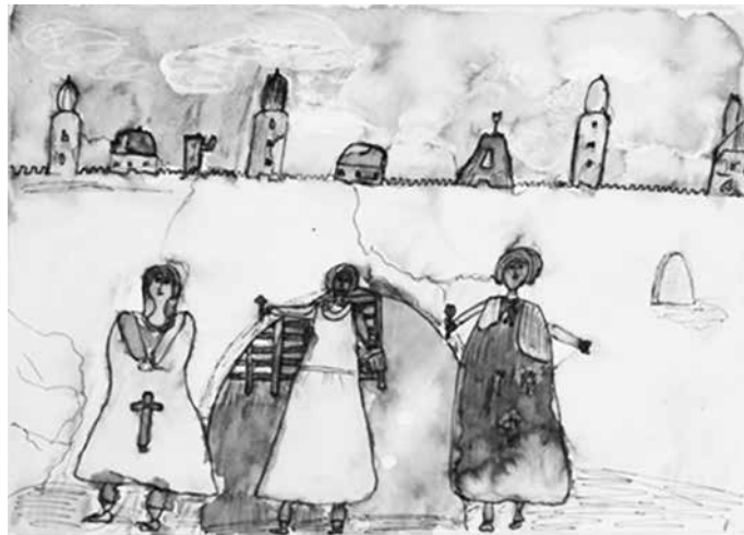
5. místo – Vojtěch Šíra 3. ročník