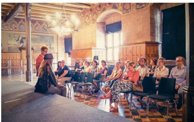
Prohlídka městské radnice v Göttingenu

Všechny nás ale dlouhá cesta natolik unavila, že všechno, co následovalo, byla jen krátká instruktáž o nejbližším programu a rozdělení členů chrámového sboru do německých rodin, které jim poskytly ubytování po celou dobu naší návštěvy. My, jakožto schola, jsme měli spaní zařízené v nedalekém hotelu.