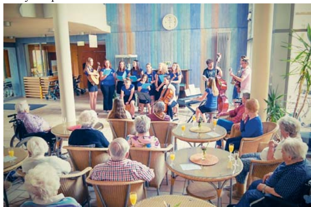
Vystoupení scholy v Johannishofu

V sobotu nás čekal opět výlet do Göttingenu, tentokrát jsme ovšem byli vypuštěni do víru velkoměsta a mohli tak celé dopoledne strávit, jak jsme jen chtěli. V kavárně, procházkou, na zmrzlině... Co si ale budeme... Valná většina z nás, jako správní shopaholici, vyrazila na nákupy. Když náš volný čas vypršel, přemístili jsme se do domova důchodců Johannishof, kde jsme my (schola) právě pro obyvatele domova měli připravené krátké vystoupení.