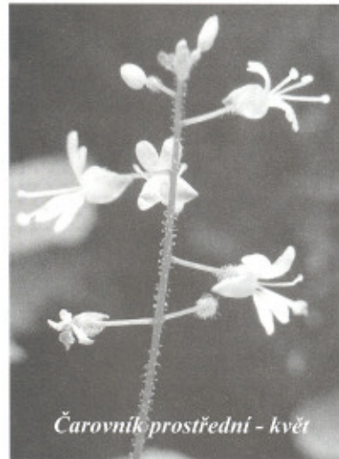
Čarovník prostřední - květ

Až 150 cm vysoká ostřice převislá / Carex pendula / patří do skupiny rostlin podobných trávám. Latinský název rostliny je příhodný. Carere znamená skrábat. Některé ostřice mají opravdu drsné, ostré listy a také trojhrannou lodyhu. V České republice roste hodně druhů ostřic. Jednotlivé druhy se velmi špatně rozlišují. Ostřice převislá patří mezi různoklasé ostřice. Klásky samčích květů jsou uspořádány nad velmi dlouhými klásky samičích květů, které visí dolů. Proto se ostřice jmenuje převislá. V České republice se vyskytuje vzácně až roztroušeně. V Beskydech se vyskytuje hojněji, protože se jedná se o karpatský druh. V Zubří ji můžeme vidět např. v místní části Boňkov. Na stejném místě spolu s ostřicí převislou může růst podobná, 30 až 100 cm vysoká ostřice lesní. Běžnější ostřice lesní má listy jasněji zelené a užší než ostřice převislá.