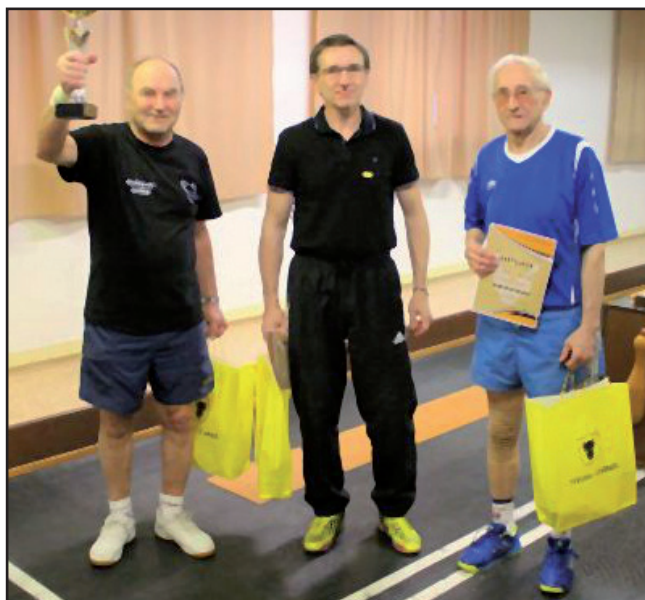
1. místo Marodi.

Konečná tabulka soutěže nám ukazuje, jak se soutěž vyrovnala. Minimálně na prvních čtyřech místech. Jestliže v minulém ročníku vyhráli Marodi suverénním rozdílem devíti bodů, letos již to byly jen body dva. Mezi prvním a čtvrtým byl vloni rozdíl třinácti bodů, letos jen body čtyři. Samozřejmě nelze náskok zcela srovnávat, protože minulý rok startovalo v lize o tři týmy více. Ale ztráta pěti bodů cel-