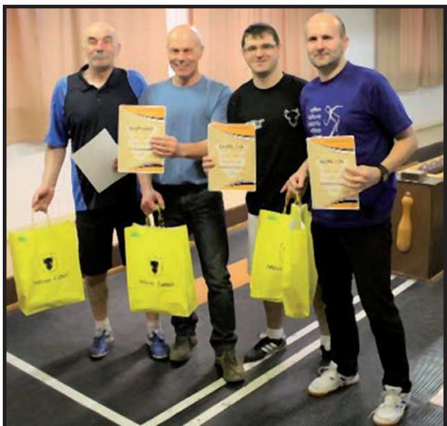
2. místo Tip Café.