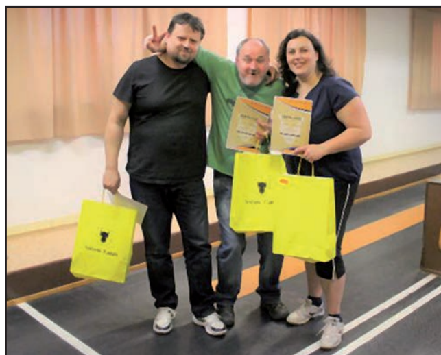
3. místo Oktopus.

ku Marodů je povzbuzením pro ostatní týmy a zároveň zdviženým prstem pro Marody, že i s ostatními se bude muset v dalším ročníku vážně počítat.