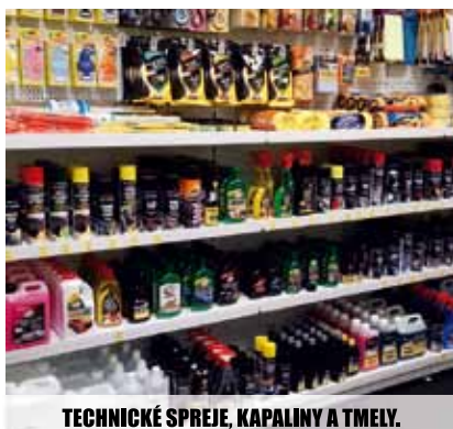
TECHNICKÉ SPREJE, KAPALINY A TMELY.