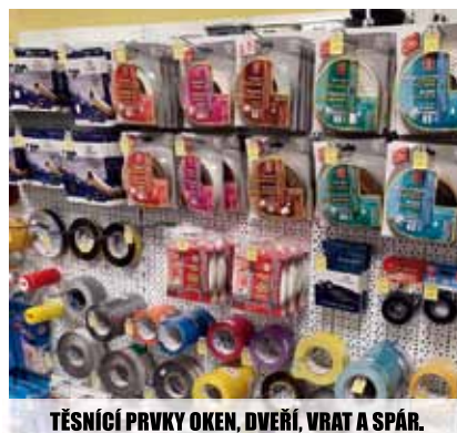
TĚSNÍCÍ PRVKY OKEN, DVEŘÍ, VRAT A SPÁR.

NEUSTÁLE ROZŠÍŘUJEME NAŠI ŠIROKOU NABÍDKU ZBOŽÍ. NAVŠTIVTE NÁŠ OBCHOD!