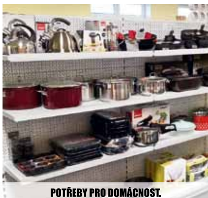
POTŘEBY PRO DOMÁCNOST.