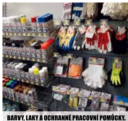
BARVY, LAKY A OCHRANNÉ PRACOVNÍ POMŮCKY.