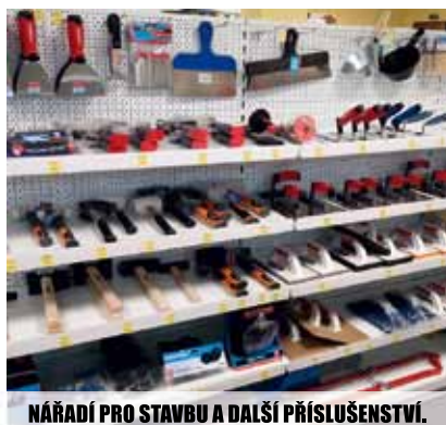
NÁŘADÍ PRO STAVBU A DALŠÍ PŘÍSLUŠENSTVÍ.