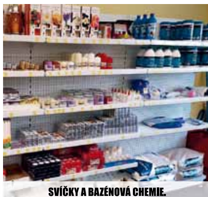
SVÍČKY A BAZÉNOVÁ CHEMIE.