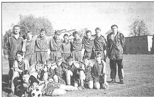
Družstvo žáků představujeme na fotografii:

Naši žáci nám dělají radost jak svými výkony a poctivostí tréninků, tak i umístěním v tabulce skupiny D, kde v současné tabulce jsou na 1. místě. Ze 12ti utkání 9x zvítězili, 2x hráli nerozhodně, 1x prohráli. Skóre 35:10, bodů 29.