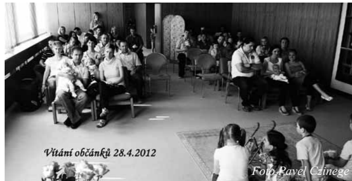
Vítání občánků 28.4.2012