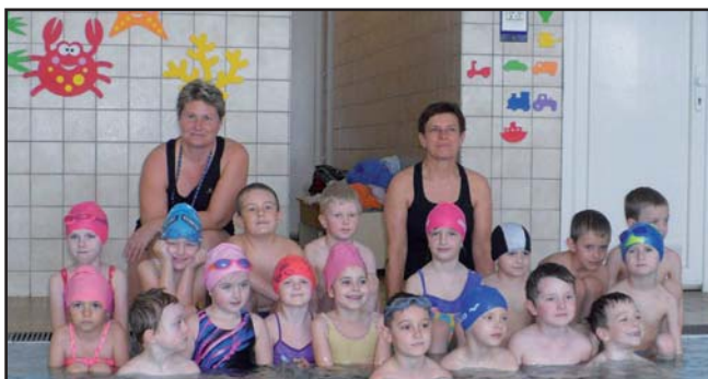
Na fotografii jsou děti ze tříd „Motýlci“ a „Sluníčka“

Vodní sporty mě moc baví, náladu mi vždycky spraví. Neznám větší zábavu, a tak si hned zaplavu. Chvilí prsa, chvílí znak, už to umím – je to tak!