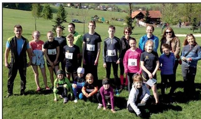
Foto ze závodu v Hukvaldech

Sílu našich nohou jsme si prověřili při běhu do kopce tradičním výběhem z Valašského Meziříčí na Lhoty. Velmi se nám dařilo i při druhém kole Frenštátského běžeckého poháru, tentokrát v Trojanovicích, který byl posledním závodem před závodem jara – Desítkou okolo komína, v němž v okolí Dezy proběhnou silniční závody pro všechny věkové kategorie.