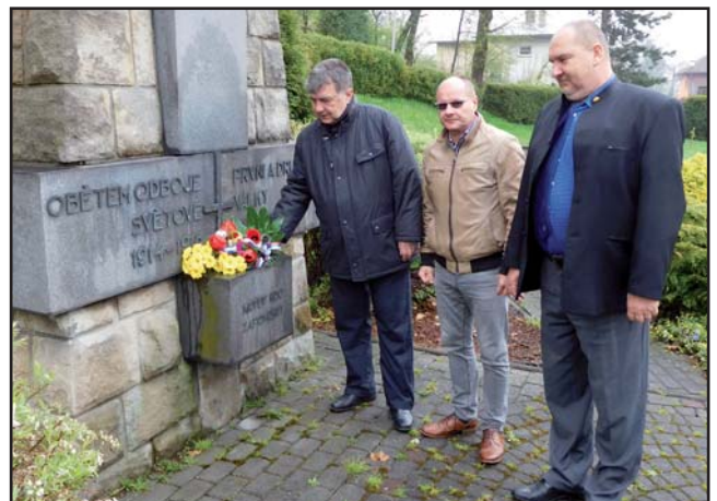
8. května si zástupci vedení města Zubří připomněli výročí konce 2. světové války v Evropě.