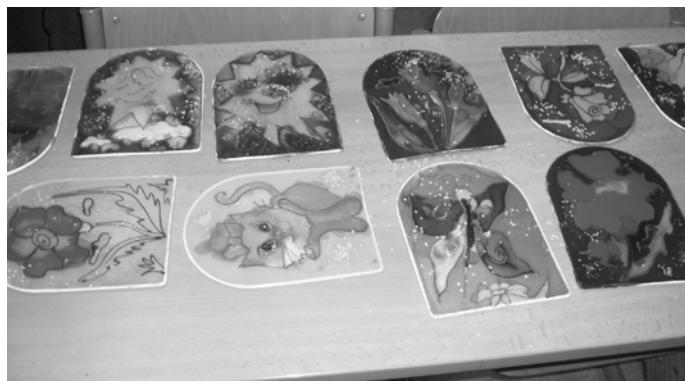
malba na hedvábí