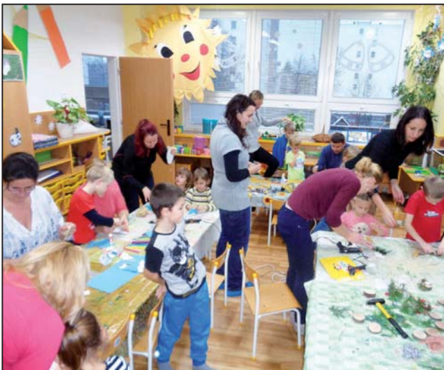
Vánoční tvoření s rodiči u Sluníček. Děkujeme všem rodičům za velkou účast a příjemnou atmosféru!