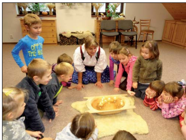
Návštěva Sluníček v Ekocentru Valašské Meziříčí na programu Vánoční zvyky a tradice na Valašsku