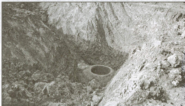
Lomová šachta na Vaculínově

V rozpočtu obce na letošní rok byla schválena na tuto stavbu částka 1 mil. Kč. Odbor výstavby zajistil stavební povolení a následně dodavatele stavby, který vyšel ze zadání veřejné zakázky. Pro stavbu kanalizace byla vybrána firma COBLER Zašová, která nabídla, že stavbu zrealizuje celou ještě v letošním roce s tím, že obec Zubří v roce 1996 zaplatí zálohu ve výši 25% z celkových nákladů stavby. Zbytek nákladů zaplatí obec až v roce 1997. Stavba kanalizace byla zahájena v průběhu měsíce září a v současné době i přes velkou nepřízeň počasí je ze 3/4 provedena. Dá se předpokládat, že v letošním roce bude kanalizace dokončena. Jen rozhrnutí ornice se provede v jarních měsících. Kanalizace se provádí z trub PVC DN 500 a je uložena v některých úsecích až v hloubce 5,5 m. Tato kanalizace 2x přechází přes vodní náhon