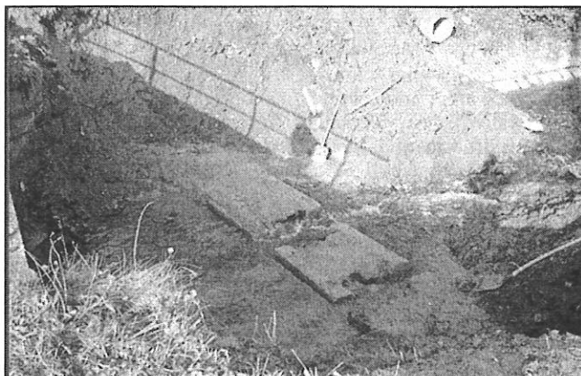
Příprava pro splávek - u Mizery

Opravy se provádějí těžce pro vysoký stav vody. Pokud dovolí počasí, budou práce i na dalších poškozených místech toku pokračovat.