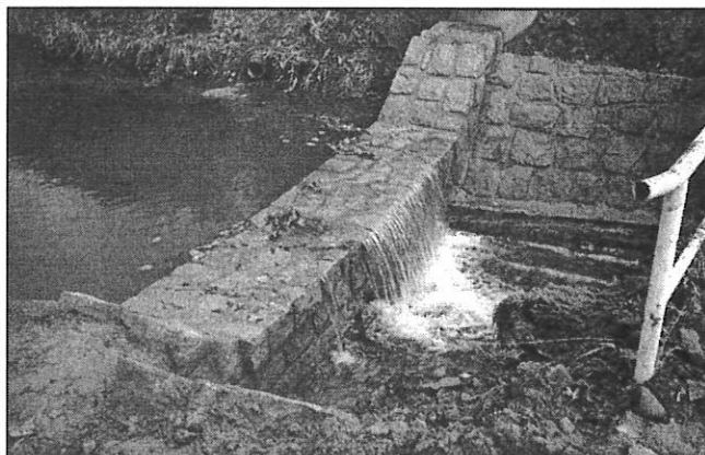
Budoucí přechod kanalizace přes potok u Č. Mizery - Horní konec

V letošním roce byla zahájena údržba Hodorfského potoka v horní části obce. Některé úseky jsou opravovány podle již dříve zpracované dokumentace. Průběh opravy je zachycen na fotografiích, které dokumentují stav před zahájením opravy a bezprostředně po dokončení. Ve vzniklé hrázi je umístěno potrubí pro budoucí kanalizaci horního konce. Operativně se opravují úseky na Starém Zubří a Poštovní ulici, které byly označeny za kritické po zářijové povodni.