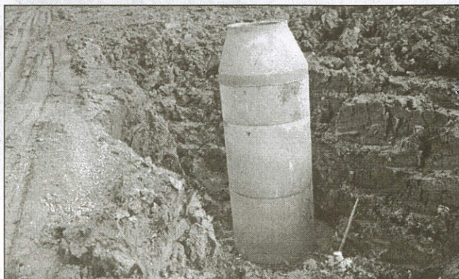
Šachta na Šimurdově