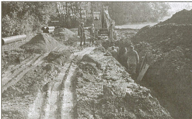
Vaculínovo - u struhy

V rozpočtu obce na letošní rok byla schválena na tuto stavbu částka 1 mil. Kč. Odbor výstavby zajistil stavební povolení a následně dodavatele stavby, který vyšel ze zadání veřejné zakázky. Pro stavbu kanalizace byla vybrána firma COBLER Zašová, která nabídla, že stavbu zrealizuje celou ještě v letošním roce s tím, že obec Zubří v roce 1996 zaplatí zálohu ve výši 25% z celkových nákladů stavby. Zbytek nákladů zaplatí obec až v roce 1997. Stavba kanalizace byla zahájena v průběhu měsíce září a v současné době i přes velkou nepřízeň počasí je ze 3/4 provedena. Dá se předpokládat, že v letošním roce bude kanalizace dokončena. Jen rozhrnutí ornice se provede v jarních měsících. Kanalizace se provádí z trub PVC DN 500 a je uložena v některých úsecích až v hloubce 5,5 m. Tato kanalizace 2x přechází přes vodní náhon