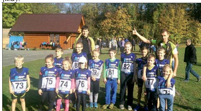
Naše žákovské družstvo před startem na Bučiskách

Z pohledu tréninku je přechod z letní přípravy na zimní tím nejdůležitějším obdobím. Proto od září do konce října pořádaly jednotlivé lyžařské oddíly závody v přespolním běhu, aby tak vylepšily fyzickou připravenost běžkařů na zimní sezónu. Náš oddíl si nevedl vůbec špatně a všichni naši svěřenci svou často náročnou a dlouhou trať zvládli bez problémů. Těm, co se postavili na stupně vítězů, gratulujeme a ostatním děkujeme za účast a reprezentaci našeho oddílu. Nyní, měsíc před přechodem na první sníh, zařazujeme do přípravy více tréninkových prostředků. Pondělní tréninky v tělocvičně zaměřujeme především na rozvoj síly a rovnováhy. Ve čtvrtek pak zařazujeme kolečkové lyže, brusle, lyžařské imitace a rozvoj vytrvalosti. Toto doporučujeme i rekreačním lyžařům, aby byl i jejich přechod na první sníh co možná nejméně bolestivý a tento nádherný sport si užívali od první jízdy.