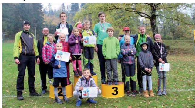
Po vyhlášení výsledků ve Veřovicích

Výsledky a další informace z činnosti najdete na našich webových stránkách.