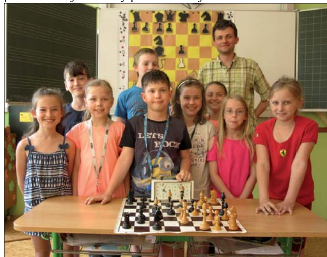
Ukončení šachového kroužku 2016–2017

V závěru května, v poslední hodině šachového kroužku, dostaly přítomné děti diplomy o absolvování kroužku. A některým z nich se královská hra zalíbila natolik, že si i nyní chodivají zahrát šachy do sokolovny, kde se v klubovně od podzimu do jara každý pátek scházejí také oddíloví šachisté.