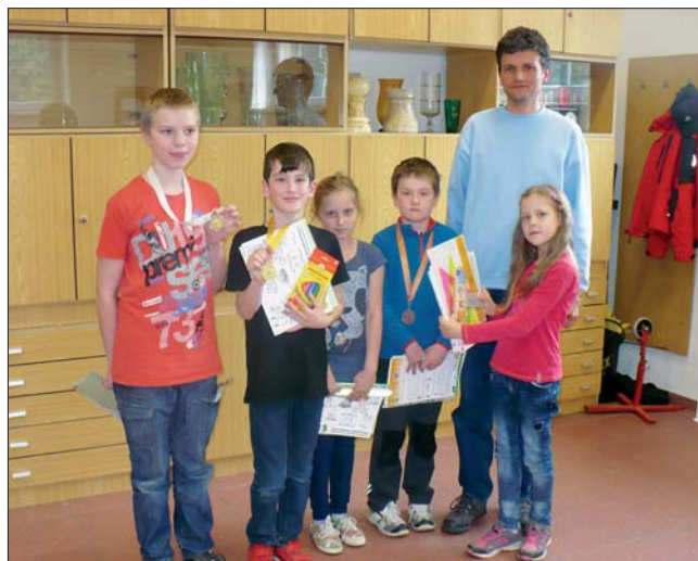
„Přebor šachového kroužku“ – účastníci turnaje