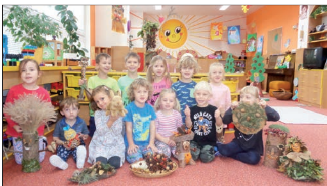
MŠ Sídliště - Sluníčka a podzimníčci.