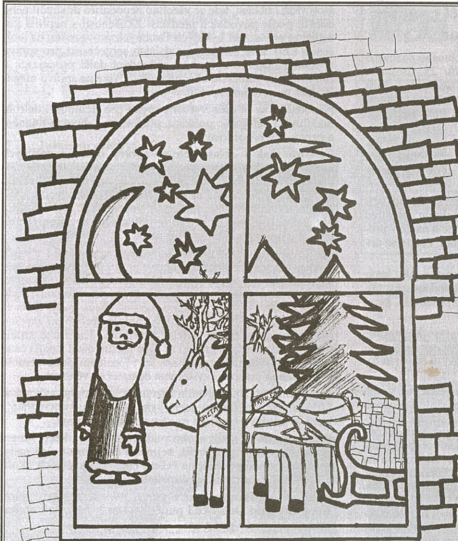
Kresba: Míša Nováčková