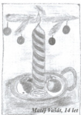
Matěj Vašát, 14 let