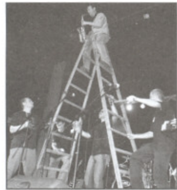
Mňága a Žďorp