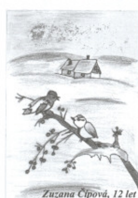
Zuzana Čipová, 12 let