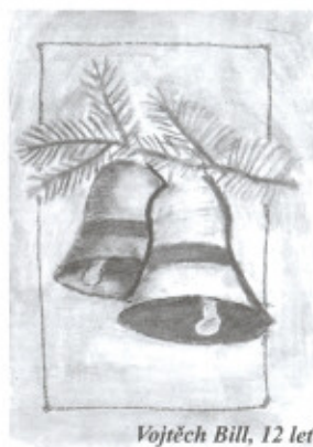
Vojtěch Bill, 12 let