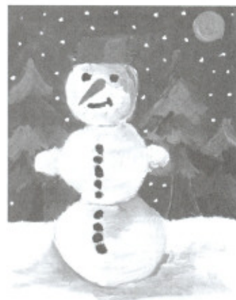
Patrik Rada, 14 let