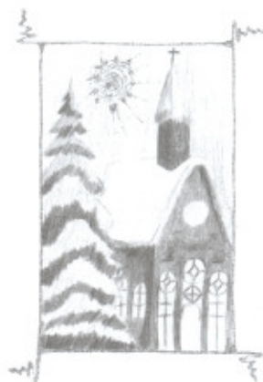
Sabina Krúzová, 13 let