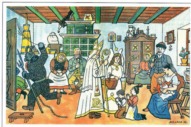
Pohlednice Josef Lada, Návštěva sv. Mikuláše, 1932

V předvečer svátku svaté Barbory procházely vesnicí “Barborky”. Ženské postavy zahalené do bílého prostěradla či šatů se závojem či rouškou přes obličej. V ruce držely košík s ovocem a sladkostmi, jimiž podělily děti, ve druhé měly metlu, kterou zlobivým dětem hrozily. Svůj příchod ohlašovaly zvonkem, tlučením na okno nebo jen tak tiše vstoupily, pozdravily, zazpívaly píseň o sv. Barboře, někdy se s rodinou pomodlily a pokračovaly k sousedům. V den svaté Barbory řezali lidé třešňové větvičky. Sloužily nejen na ozdobu světnice, ale prostřednictvím nich se také věštilo, pokud ve váze vykvety. Děvčata pojmenovala každou větvičku jménem některého chlapce a věřila, že si vezmou toho, jehož jméno ponese ta, která první rozkvetne. Nebo se počítalo, kolikátý den po sv. Barboře větvička rozkvetne, aby se určil nejtřastnější měsíc příštího roku.