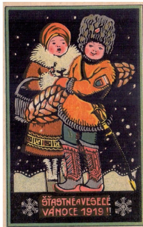
Dopisnice z Velké války, 1919

Trvaly 12 dnů - od svatě noci (Štědrého večera) až do svátku Tří králů (6. 1.). V tuto dobu se slavily svátky sv. Jana Evangelisty či den Mlád'átek, připomínající památku zavražděných chlapců králem Herodem v Betlémě v období narození Ježíše. Vánoční svátky byly spojovány se vzájemnou štedrostí, koledou, oslavou, ale i magickými rituály, které přetrvaly z pohanských dob a měly zajistit lepší budoucnost v následujícím roce. A jak to bylo s vánočním stromčkem? Ještě z období pohanských oslav zimního slunovratu přetrval zvyk zdobit obydlí větvemi jehličnanů, protože zeleň symbolizovala život. V 18. století bylo chvoji v obydlí doplněno betlémem. První vánoční stromek se rozzářil v roce 1812 v Praze. Pro své přátele jej vystrojil ředitel Stavovské divadla Liebich, který ho znal z rodného Bavorska. Zvyk zdobit vánoční stromek se u nás uchytil. Ke konci 19. století se nejprve objevoval v městských, úřednických rodinách či ve školách. V roce 1880 se v Zubří uskutečnila i první slavnost vánočního stromu v Zubří. A to pro žáky dolní školy. Stromček byl ozdoben červenými stužkami, oříšky, vánočním cukrovím a někdy i kousky cukru zabalenými v barevném papíře. Skleněné ozdoby se na stromčku objevily až v meziválečném období.