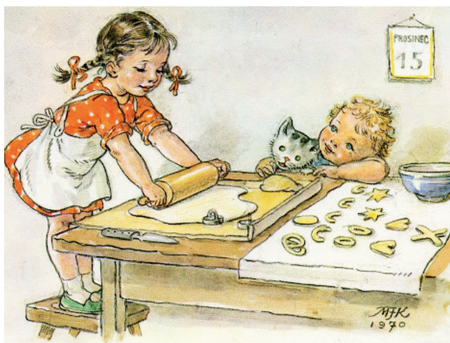
Pohlednice Marie Fišerové-Kvěchové, Pečeme vánoční cukroví, 1970

Dny po svatě Lucii rychle utíkaly, na adventním věnci se v neděli zapálila třetí svíčka. Ta by měla být růžová narozdíl od zbylých, které jsou fialové. A proč růžová? Má symbolizovat přátelství. Zbylé symbolizují naději, mír, čtvrtá lásku. A kdy se svíčky rozzářily na adventním věnci poprvé? Tradice adventního věnce byla založena v 19. století v Německu. Protestantický teolog a učitel Johann Hinrich Wichern v roce 1839 pro své žáky vyrobil předchůdce dnešního adventního věnce, aby zkrátil dětem čekání na Vánoce. Na staré dřevěné kolo nalepil 19 malých červených svíček pro všední dny a 4 bílé svíce pro neděle. Myšlenka se rychle zalíbila a zanedlouho se první adventní věnce objevily v kostelích v Čáchách. Ty už však měly jenom čtyři svíce jako symbol čtyř adventních nedělí. U nás se zvyk uchytil až někdy v polovině 20. století.