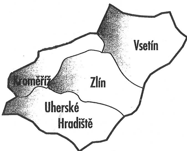
Pro názornost uveřejňujeme mapku Zlínského kraje, tvořeného stávajícími čtyřmi okrsky.

Jsmo rádi, že něco děláte pro své zdraví.