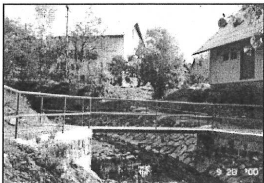
Nová lávka na Bořkovu