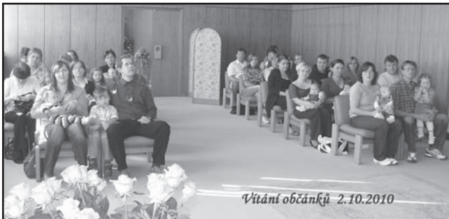
Vítání občánků 2.10.2010