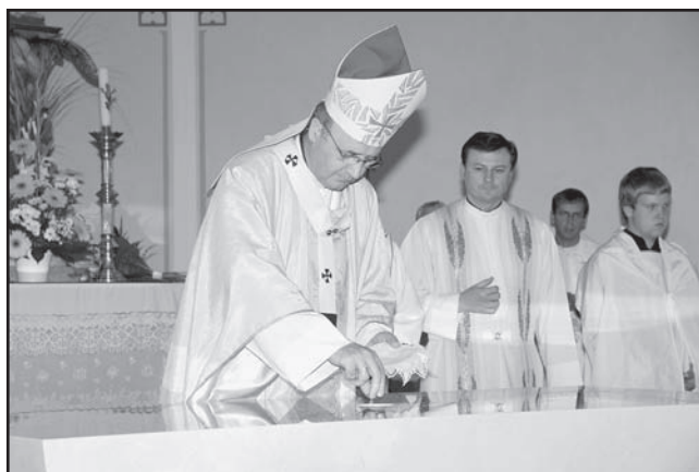
Vkládání ostatků do oltáře