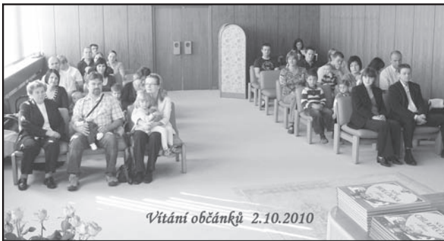
Vítání občánků 2.10.2010