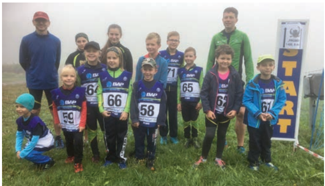
Ze závodu ve Veselé

V září se tradičně rozběhly přípravné závody v přespolním běhu pořádané lyžařskými oddíly ve Zlínském a Moravskoslezském kraji. První závod, který poprvé organizoval oddíl SKIBI Valašské Meziříčí, proběhl okolo lyžařského vleku ve Veselé.