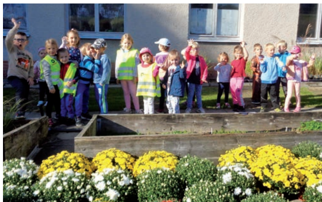
Návštěva Osevy Zubří Děkujeme za krásný program a hezké povídání o travinách.