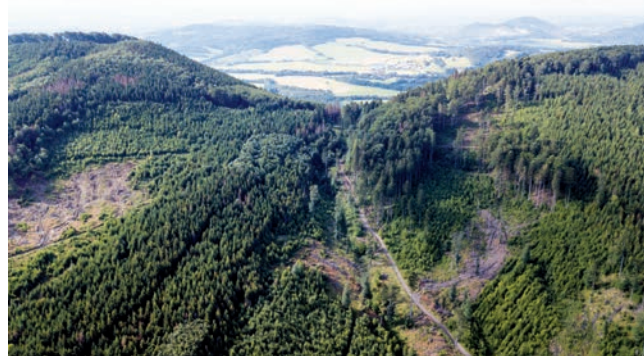
Letecký pohled na Hodorfské sedlo, v pozadí Kotouč u Štramberka

Abychom však pochopili celý příběh, musíme se vrátit až do 13. století. V té době začíná tzv. velká středověká kolonizace, kdy jsou osidlovány do té doby pusté lesy v dnešním pohraničí. Příznivé podmínky tehdy umožnily pánům zakládat sídla „na zelené louce“, a tak vzniká celá řada nových vesnic. Zároveň jsou podle vzorů ze západu budována nová města a první kamenné hrady. Kvůli nedostatku domácího obyvatelstva jsou do těchto sídel zváni především německy mluvící kolonisté, a tím vznikají pozdější Sudety. Osídlení našich zemí tak pomalu dostává dnešní podobu, a i když se v následujících stáletích rozrůstá, jeho struktura se již příliš nemění. Ne vždy však byly snahy kolonizátorů úspěšné. Středověk byla těžká doba, a tak některé vesnice krátce po svém založení opět zanikají ať už kvůli válkám, epidemiím, nebo jen špatné hospodářské situaci. Některé z nich mohly být v pozdější době obnoveny, ale