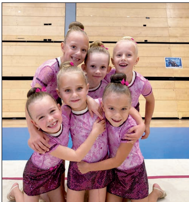
6 let a mladší