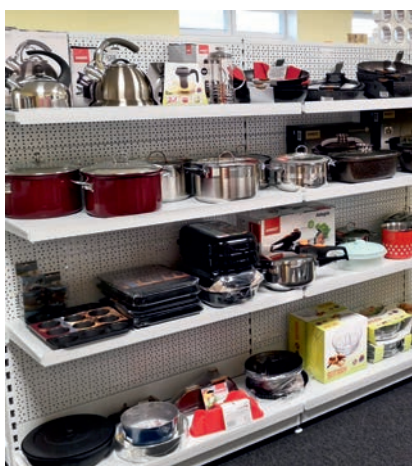
POTŘEBY PRO DOMÁCNOST