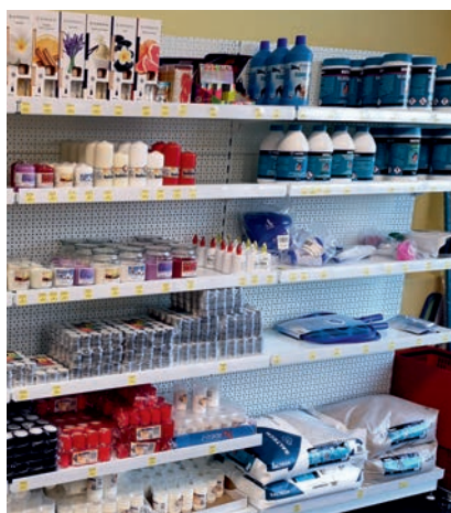
SVÍČKY A BAZÉNOVÁ CHEMIE