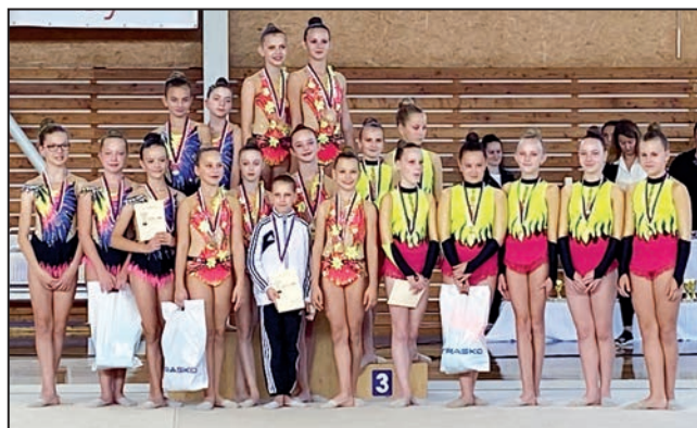
Krátký program 10 – 12 let

Za úspěšnou reprezentaci děkujeme gymnastkám a jejich trenérkám, rodičům za podporu a přejeme hodně štěstí a elánu do dalšího trénování.