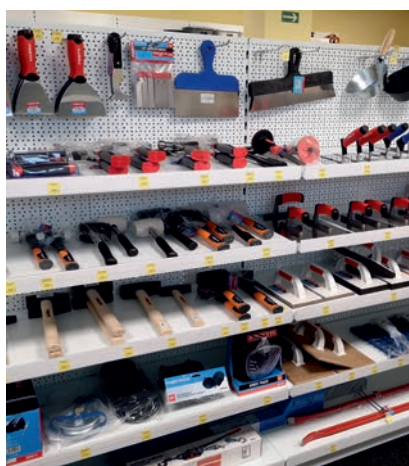
NÁŘADÍ NEJEN PRO VAŠI STAVBU