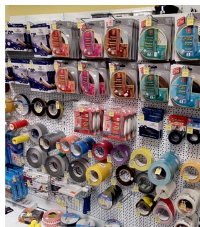
TĚSNICÍ PRVKY OKEN, DVEŘÍ A VRAT