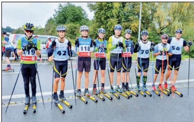
Zuberská sestava pro hlavní závod