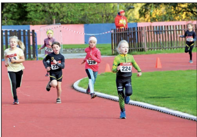
Zuberské Minižačky vyběhají z poslední zatáčky