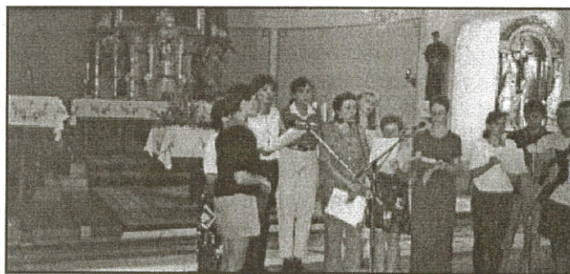
Vystoupení souboru SCHOLA v zuberském kostele

UPOZORNĚNÍ Firma ENERGOFIN holding Praha oznamuje občanům, že získala finanční částku 4,5 mld. Kč na účely obnovy bytového fondu a zařízení v bytové a komunální sféře.