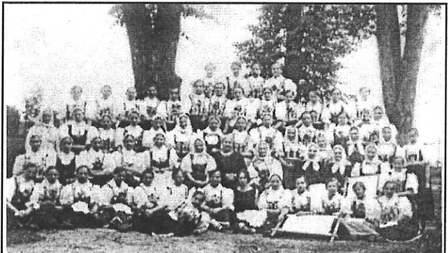
Zuberské vyšívачky (r. 1924)

móda se začala odklánět od domácích tradic.