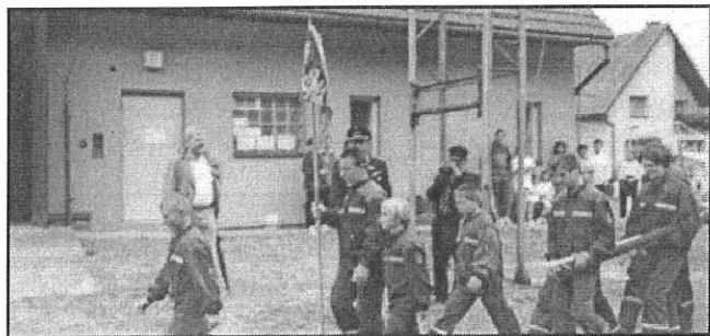
Nástup mladých hasičů při zahájení letního tábora na Starém Zubří.

Ve dnech 24.7. - 31.7.1999 se již po druhé uskutečnil v areálu hasičské zbrojnice na Starém Zubří společný letní tábor mladých hasičů ze Zubří a z partnerské obce Rosdorf. Po třech letech se na Starém Zubří opět setkali staří přátelé, kteří mezitím o něco vyrostli a ty starší, odrostlé, vystřídali jejich mladší kamarádi. Přijeli k nám mladí hasiči z Rosdorfu, aby společně s našimi dětmi strávili 8 hezkých dnů plných her, soutěží, turistiky a zábavy. Letošní tábor se uskutečnil i díky Českoněmeckému fondu budoucnosti, který byl před dvěma lety založen za účelem všestranné podpory porozumění mezi Čechy a Němci a který poskytl finanční příspěvek na výdaje spojené s táborem.