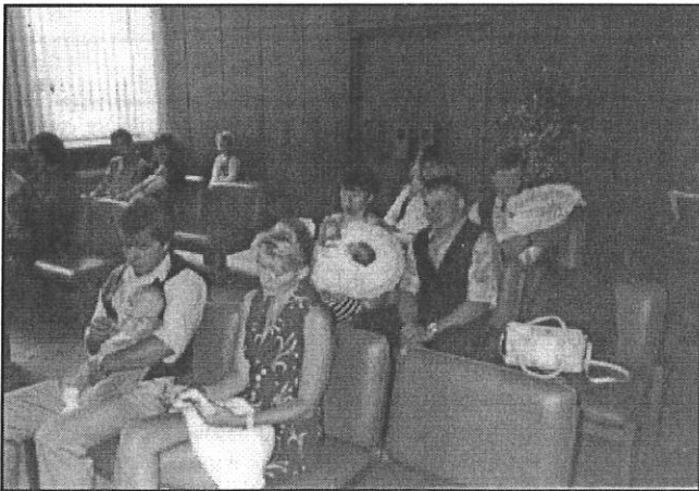
24.7.1999 slavnostní vítání malých občánků.