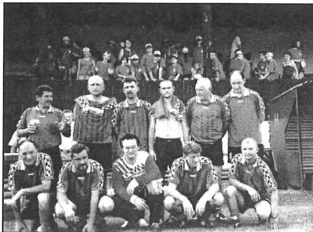
Náš tým "fotbalistů" po zápase, ve kterém Palárikovo vyhrálo 3:1

K dětským táborům patří i večerní zábava, která nechyběla ani zde. Posezení při ohni, seznamovací večírek, diskotéky, soutěž správný chlapec, správná dívka, zpěv za doprovodu harmoniky pana starosty doplnily pestrý program. Na jeden týden toho bylo až moc, vše se vydařilo.