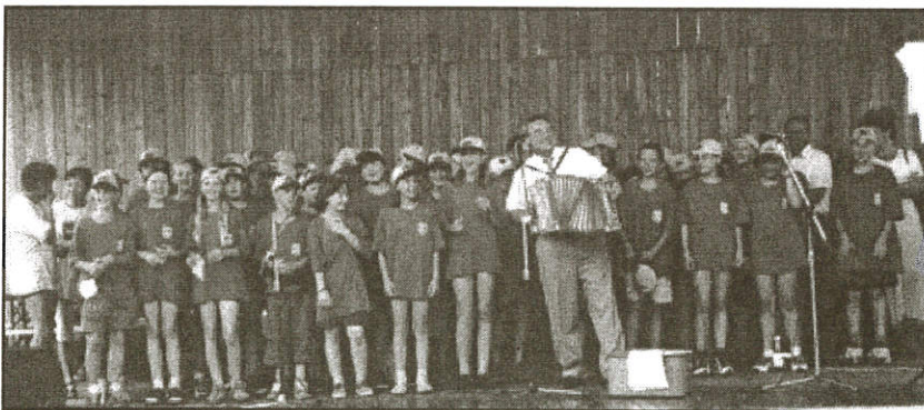
Společné vystoupení zuberských a palárikovských táborníků – na harmoniku doprovází starosta Palárikova.

Program byl velmi bohatý, hostitelé chtěli dětem ukázat maximum. Začali jsme pěší prohlídkou Palárikova, návštěvou zámku a večerním posezením v jídelně školy. Naše děti předaly kamarádům dárečky a všichni dostali od Obecního úřadu modrá trička a žluté čepice se znakem Palárikova. Děti v nich velmi rády chodily a nám vedoucím to nesmírně pomohlo hlavně při zájezdech, poněvadž 40 modrých triček bylo k nepřehlédnutí.