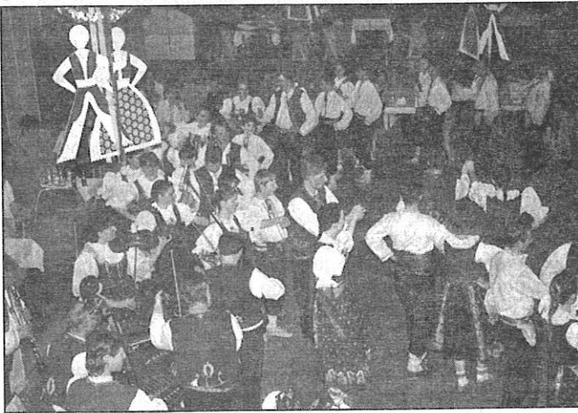
Z letošního bálu jsme foto nedostali. Podívejte se tedy, jaký byl ten loňský Valašský bál.

Valašský bál je v poslední době připravován mnohem vstřícněji i pro širokou veřejnost. A proto nás mrzí stále klesající počet krojovaných na bále.