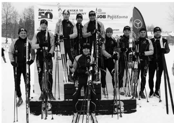
Oddíl běžeckého lyžování GZUZU na Jiz50

V prosinci zástupci TJ Gumárny Zubří oddílu klasického lyžování absolvovali dva závody krajského přeboru na Pustevnách. Poté, hned první neděli v lednu, na ně čekala již tradiční Jizerská padesátka. Za účasti 4500 závodníků se všech 9 zuberských borců ve výsledkové listině vešlo do první poloviny startovního pole. Nutno připomenout, že tratě na Jizerce letos kvůli přivalu nového sněhu připomínaly spíše všechno jiné, než souvislou stopu, na kterou jsou všichni naši závodníci technicky velmi dobře vybaveni.