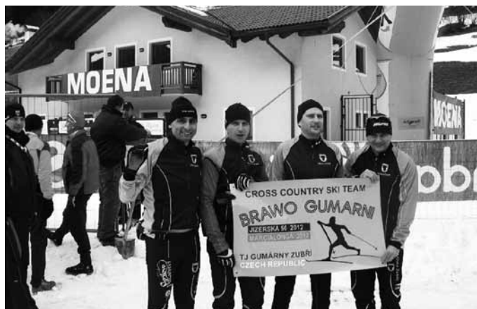
Stadión na Pustevnách během KP ZK pořádaného oddílem GZUZU

První čtyřčlenná skupina se zúčastnila 70 km dlouhého závodu v Itálii – Marcialonga, známé jako královny dálkových běhů, se svou neopakovatelnou atmosférou, kde za účasti 7000 závodníků z celého světa byli naši borci v cíli do 2100 místa ve výsledkové listině. Nutno podotknout, že k největším mediálním úspěchům patří rozhovor v přímém přenosu do rádia Dolomity, kde mimo jiné opakovaně zaznělo již na Jizerce dávno proslavené heslo našeho lyžařského oddílu „BRAVO GUMARNI“.