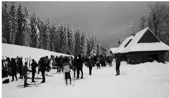
Stadión na Pustevnách během KP ZK pořádaného oddílem GZUZU

V neděli 22. 1. 2012 uspořádal náš lyžařský oddíl III. kolo krajského závodu v běhu na lyžích. Závod proběhl v nově zrekonstruovaném běžeckém areálu na Pustevnách. Jako pořadatelé jsme museli řešit kalamitní stav na závodních tratích, protože den před závodem a během noci připadlo 30 cm nového sněhu a následkem toho popadalo pár stromů. Bylo vypsáno třináct věkových kategorií a závodilo se volnou technikou. Na start se postavilo více jak 80 závodníků a byla to zároveň zatím i nejvyšší účast na krajských závodech v této sezóně ve Zlínském kraji. Oddíly z blízkého okolí se mohly porovnat s oddíly celého Moravskoslezského a Zlínského kraje. Závod proběhl na velmi dobré úrovni, pořadatelé odvedli díky precizní organizaci pěknou práci a všichni účastníci odcházeli domů sice vymrzlí, ale spokojení.