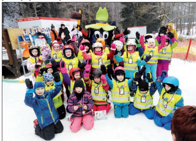
Za MŠ DUHA Markét

kopcích prohání skřítek Razulák. Co myslíte, podařilo se nám ho alespoň zahlédnout? Ano!!! Stalo se, že k ocenění za všechnu tu píli, odvahu, chuť i radost z lyžování přišel Razuláček dětem osobně poblahopřát! A my? Děkujeme za krásně prožitý týden zimy a už teď se těšíme na další.