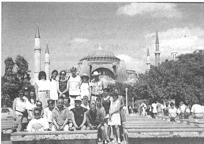
Turecko - Istanbul - Sofiina mešita