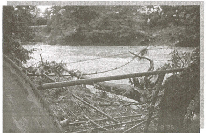
Zbytky lávky do Hájů

V mnoha případech mohly být škody poněkud menší, kdyby nebyly prováděny zásahy do toků potoků svévolným postupem občanů. Měli by se už jednou poučit občané, kteří sypou zeminu a odpady na přilehlý břeh potoka, a rodiče dětí, které vytvářejí hráze v korytě potoka, a uvědomit si, že svým jednáním ohrožují majetek a životy svých spoluobčanů.