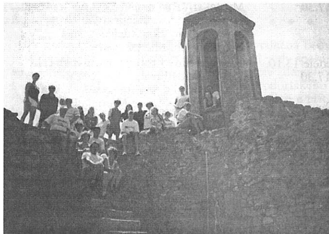
Řecko - hradby Feresu

Vždy ve dvou patnáctiminutových vstupech jsme předvedli jen to nejlepší a právem jsme byli za své výkony, i přes velké množství dotěrných komárů, odměňováni mohutnými potlesky diváků, kteří do posledního místečka zaplňovali hlediště amfiteátrů. Netančili jsme celé dny, navštívili jsme lesopark Forest of Dadia, okolní pamětihodnosti, utráceli peníze a hlavně jak jsme mohli, tak jsme byli u moře. Bylo pondělí 19. srpna. Po slavnostní večeři všech účinkujících souborů na rozloučenou nás čekala poslední noc strávená v Řecku. Bylo to neuvěřitelné, ale 6 dnů strávených v Řecku bylo ta tam a před námi dlouhá cesta domů.