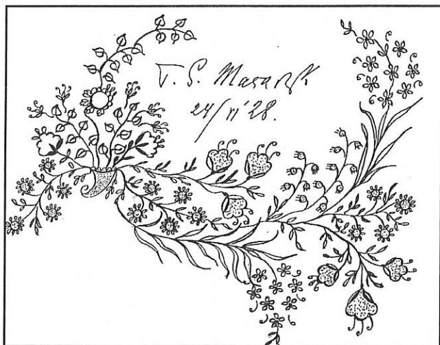
Podpis T.G. Masaryka do památníku vyšívání

Od rána však "janské pluty" potvrzovaly svoji sílu. Odpoledne však, hodinu před příjezdem celé kolony aut se vzácným hostem, zasvitlo slunce a pana presidenta vítal hustý špalír dětí, legionářů, místních spolků a občanů. Auto s p. prezidentem zastavilo, prezident vystoupil a pozdravil se s legionáři, občany, s představiteli obce, zapsal se do obecní kroniky a rovněž do pamětní knihy zuberské školy vyšívání a potom pomalu hustým špalírem občanů odjel do Val. Meziříčí.