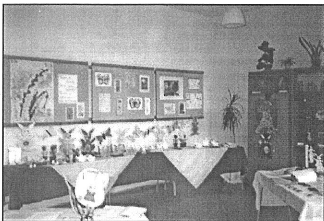
Záběr ze školní družiny naší ZŠ