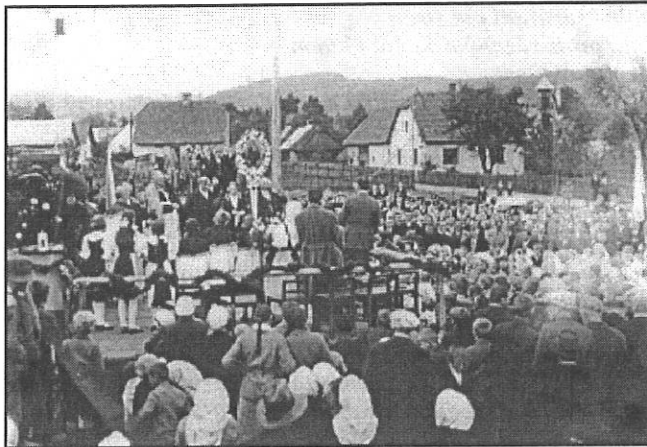
Položení základního kamene ke stavbě měšťanské školy - r. 1932

10.4.1932 byla stavba školy zadána sdružení stavitelů a 16. října 1932 byla uspořádána slavnost kladení základního kamene.