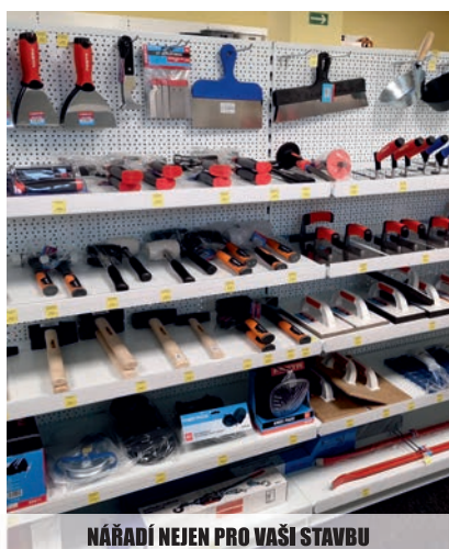
NÁŘADÍ NEJEN PRO VAŠI STAVBU