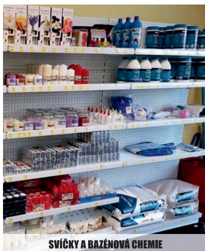
SVÍČKY A BAZÉNOVÁ CHEMIE