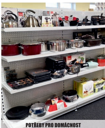
POTŘEBY PRO DOMÁCNOST