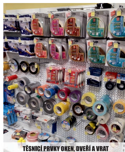
TĚSNICÍ PRVKY OKEN, DVEŘÍ A VRAT