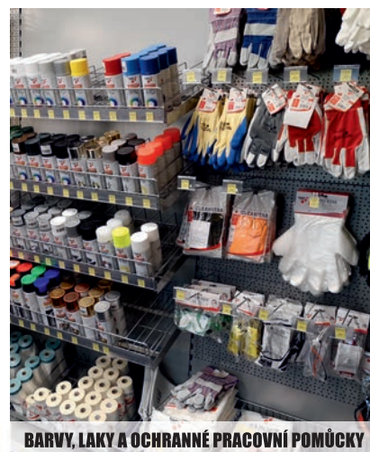
BARVY, LAKY A OCHRANNÉ PRACOVNÍ POMŮCKY